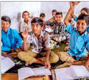
नोट- यह पड़ताल दिवनसिटी के सात नामी स्कूलों के आरटीई प्रवेश बच्चों के दाखिले के संबंध में प्राप्त दस्तावेज के आधार पर है।