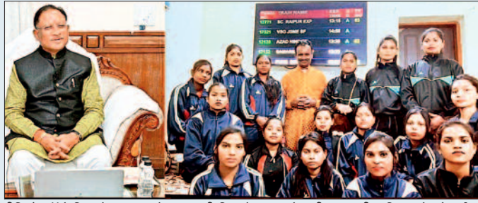
वीडियो कॉन्फ्रेंसिंग के माध्यम से मुख्यमंत्री विष्णुदेव साय ने छत्तीसगढ़ की बालिकाओं को नई दिल्ली रवाना होने पर शुभकामनाएं दी।